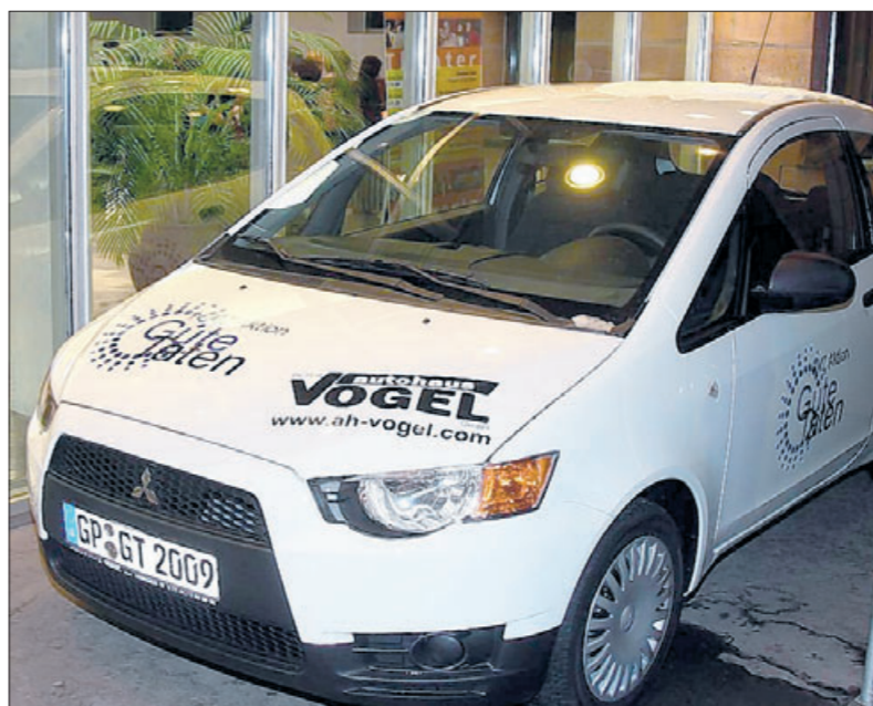
Wer gewinnt den Mitsubishi Colt?