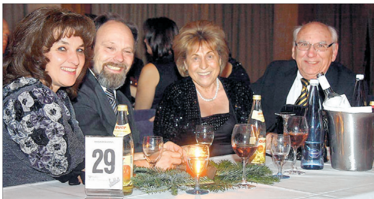
Gut gelaunte Gäste bei einem geselligen Abend in der Göppinger Stadthalle.