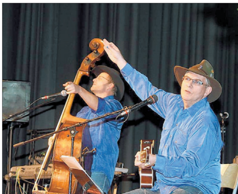
Stimmungsgaranten: das Kaosplus-Duo.