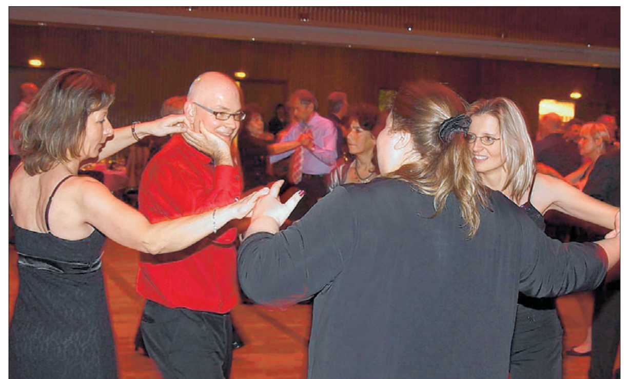
Hahn im Korb auf der Tanzfläche.