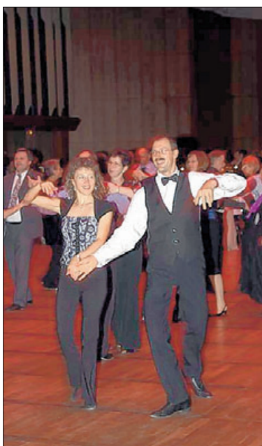
Profis auf dem Parkett.