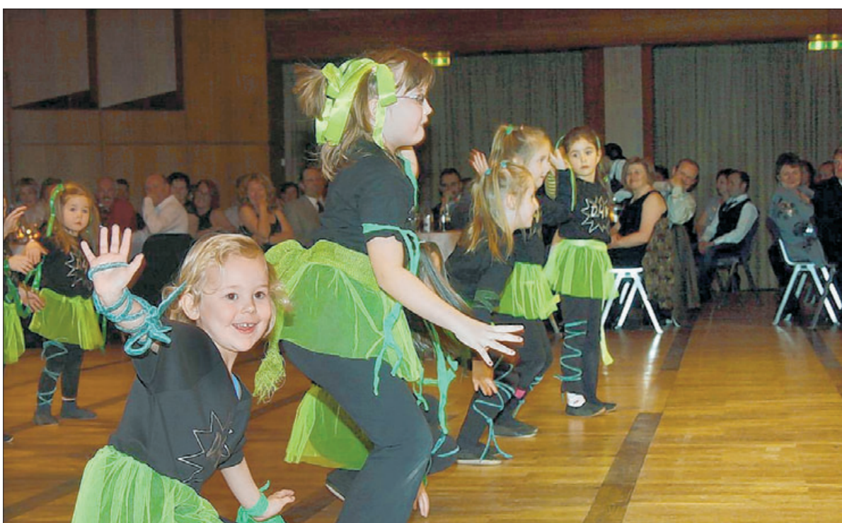
Die Jüngsten von „Dance 4 Kids“ aus Heiningen haben's gut drauf.