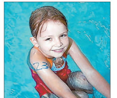
Mit Vergnügen am Start.