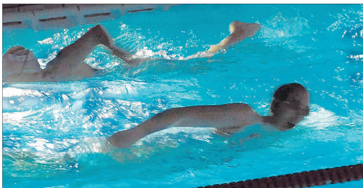
Die Nacht zum Tag gemacht.