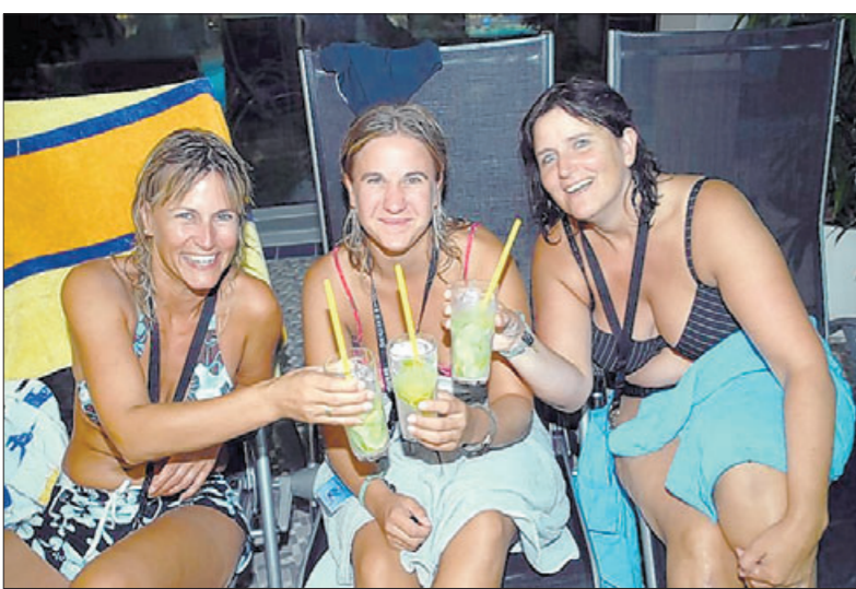
Ein Cocktail zur körperlichen und geistigen Erfrischung.