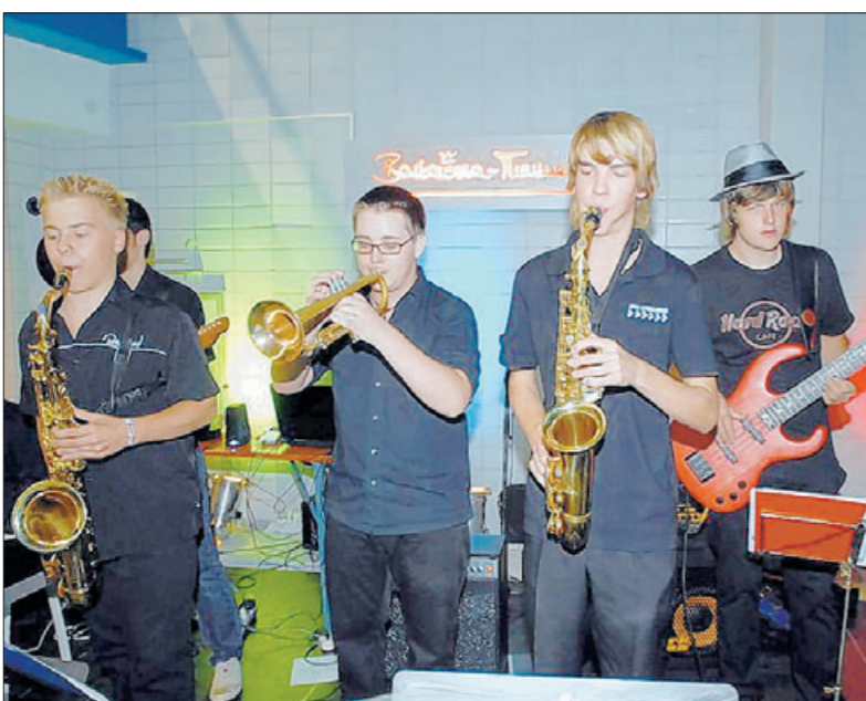
Live-Bands begleiteten am Samstagabend die Schwimmer.