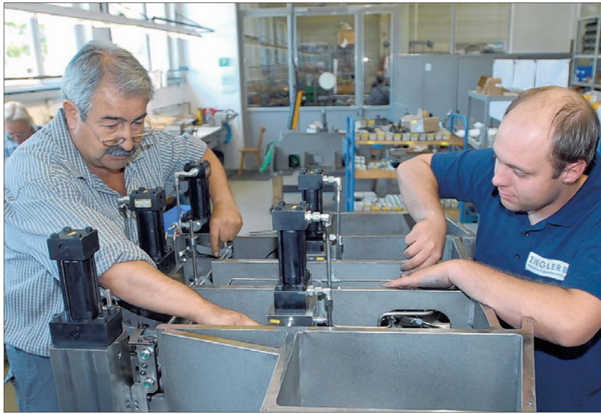
Der Werkzeug- und Maschinenbau – unser Foto entstand bei der Firma Ziegler in Göppingen – ist im Stauferkreis eine tragende Säule. Zahlreiche Unternehmen in diesem Bereich sind Marktführer.

Ich sage ja zum Stauferkreis, weil ich meine Kindheit hier verbracht habe, meine Familie und Freunde hier sind und mein Herz hier hängt.