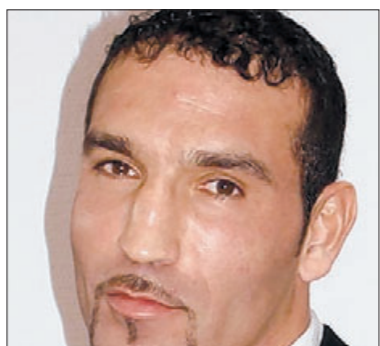
Firat Arslan, ehemaliger Box-Weltmeister aus Süßen.

Ich sage ja zum Stauferkreis, weil ich meine Kindheit hier verbracht habe, meine Familie und Freunde hier sind und mein Herz hier hängt.