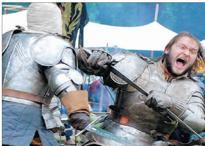
Ob je Ritter auf Burg Bezgenriet miteinander gekämpft haben, wird ein Geheimnis der Geschichte bleiben.