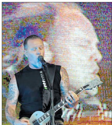
Metallica waren der Headliner auf dem Sonisphere-Festival.

Den Auftakt der bekannteren Bands boten In Extremo. Die Mittelalter-Rocker boten eine insgesamt eher durchwachsene Show. Dann kam mit The Prodigy eine Band auf die Bühne,