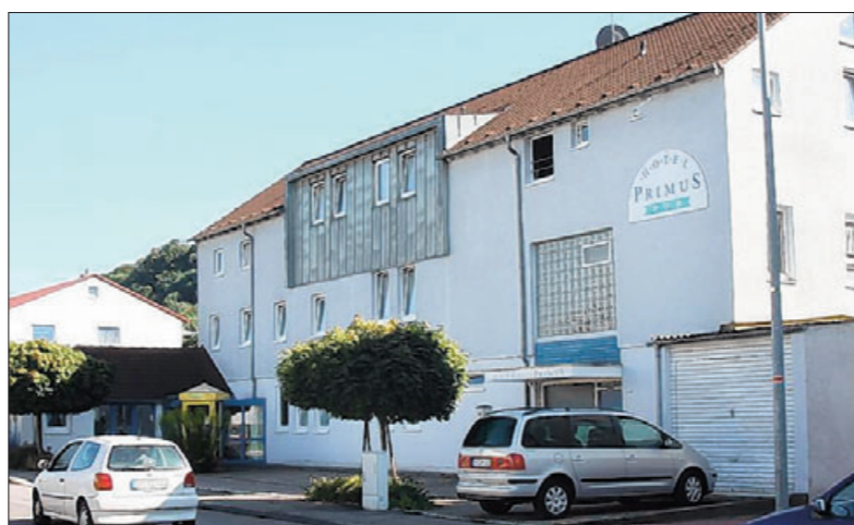
Die Firma Manus GmbH will auf dem Grundstück Heinrich-Landerer-Straße 54 in Göppingen ein Bordell einrichten. Die Stadt sieht rot.

Für die Stadtverwaltung ist klar: Der geplante Bordellbetrieb widerspricht den Absichten des Baugebietes, den die Stadt für das Gebiet „Raabestraße, Heinrich-Landerer-Straße, Jahnstraße und Heini-